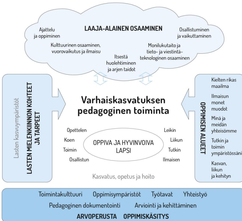
Kuvio 1. Varhaiskasvatuksen pedagogisen toiminnan viitekehys

Tavoitteellisen toiminnan perustan luovat arvoperusta (luku 2.4), oppimiskäsitys (luku 2.5), niihin pohjautuva toimintakulttuuri (luku 3) sekä monipuoliset oppimisympäristöt (luku 3.2), yhteistyö (luku 3.3) ja työtavat (luku 4.3). Lasten mielenkiinnon kohteet ja tarpeet sekä heidän kasvuympäristönsä liittyvät merkitykselliset asiat ovat toiminnan suunnittelun lähtökohtana. Lähtökohtana ovat myös luvussa 4.5 kuvatut oppimisen alueet. Laadukkaan pedagogisen toiminnan edellytyksenä on suunnitelmallinen dokumentointi, arviointi ja kehittäminen (luvut 4.2 ja 7). Laaja-alaisen osaamisen tavoitteet ohjaavat osaltaan toiminnan suunnittelua.